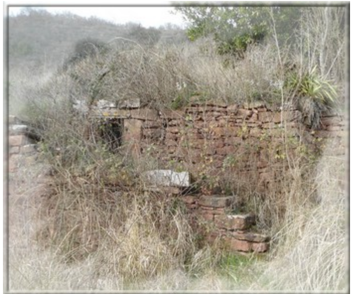
Dans le mur, une ancienne citerne